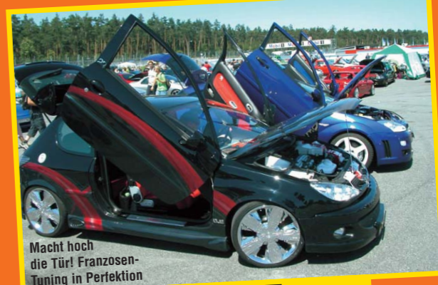
Macht hoch die Tür! Franzosen-Tuning in Perfektion

Geile Karren und heiße Girls – auf dem Hockenheimring ging's ab!