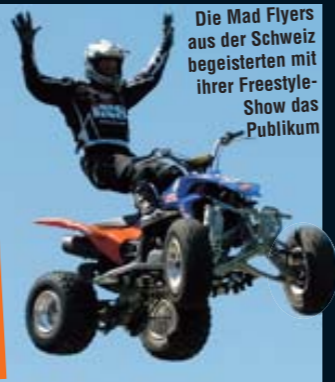
Die Mad Flyers aus der Schweiz begeisterten mit ihrer Freestyle-Show das Publikum

Werfen Sie mal einen genauen Blick auf das Gaspedal dieses Ami-Pick-ups. Verdammt cool, oder?!